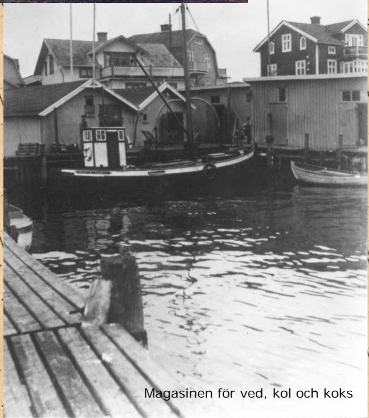
Magasinen för ved, kol och koks

ocker stemjöl Rågmjöl Potatismjöl pkt Havremjöl kg. Smör » Margarin » Flott fl Grädde fl Mjolk burk Milk litter Dricka kg. Salt, fint » mellan