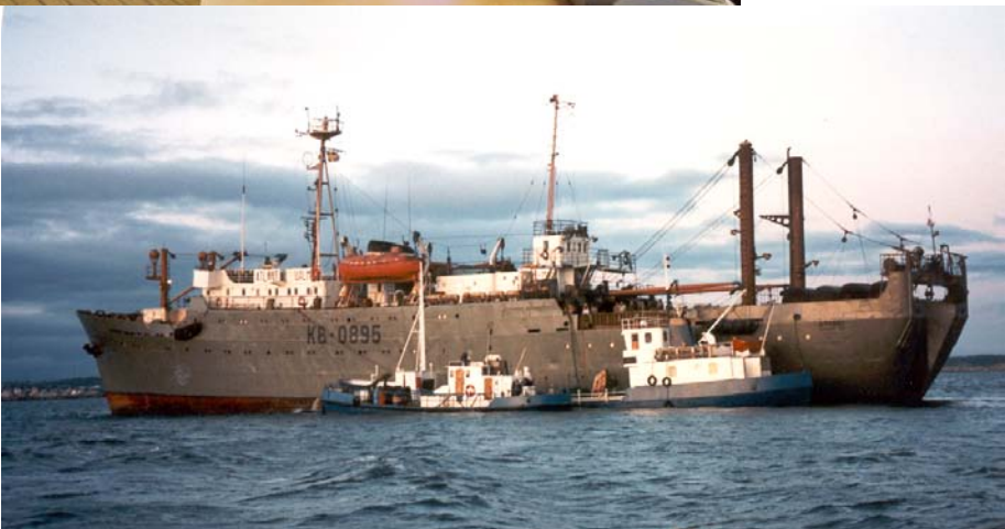
BUNKRING, SJÖBJÖRN IX & SJÖBJÖRN X